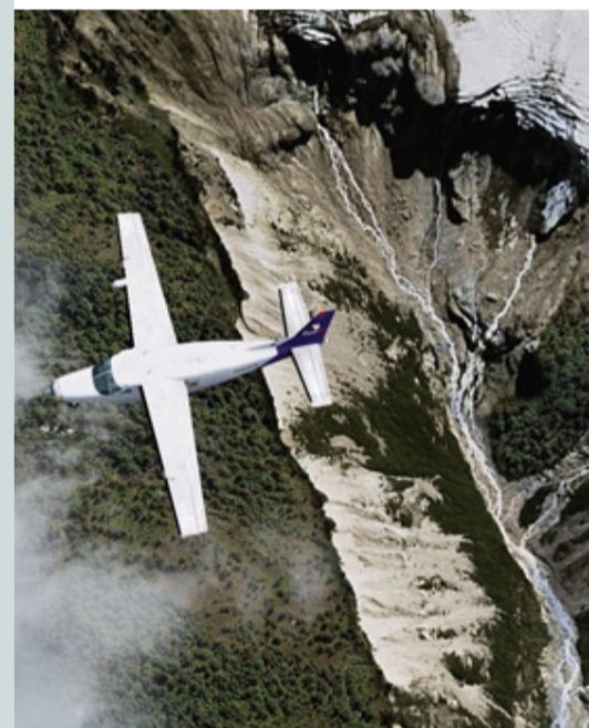
Smeltwaterstromen langs de hellingen van Mt Baker