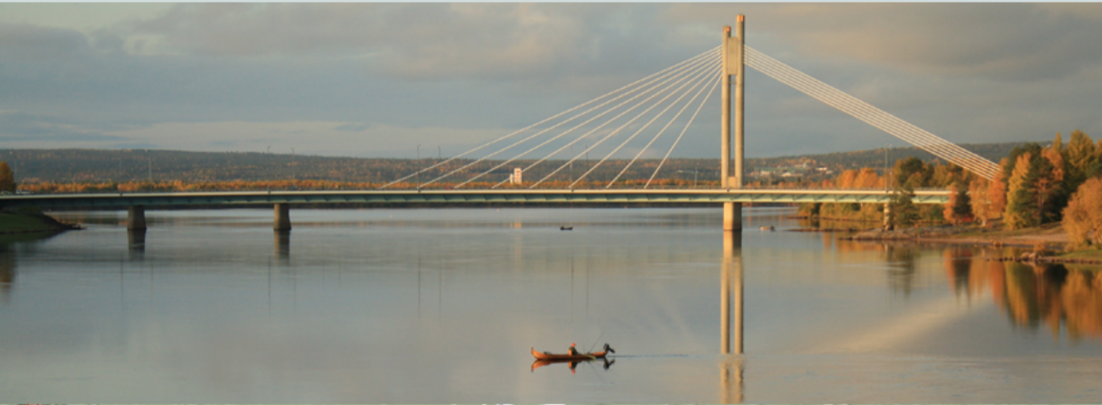
Eén van de karakteristieke bruggen bij Rovaniemi